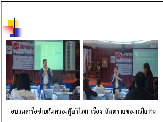
อบรมเครือข่ายคุ้มครองผู้บริโภค เรื่อง อันตรายของแเรียหิน