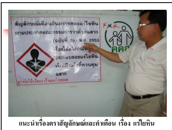
แนะนำเรื่องตราสัญลักษณ์และคำเตือน เรื่อง แรียหิน